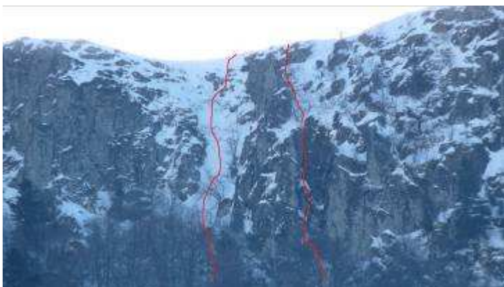
Sortie d'« Ambiance Ben »

« Ambiance Ben » : superbe couloir de neige (100 m, 65° max + corniche). L'itinéraire de droite est un mixte difficile non réalisé.